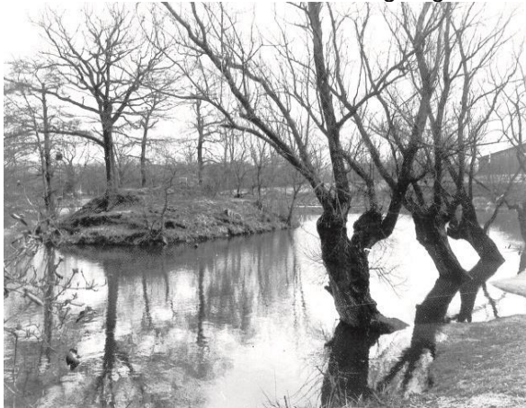
Mittelalterliche Flachlandburg, Typ Motte, Kurtekotten, 10.-13. Jahrhundert

Die unter Denkmalschutz stehende Mittelalterliche Flachlandburg Typ Motte am Kurtekotten liegt im Überschwemmungsgebiet des Mutzbaches und kontrollierte den Flussübergang einer Wegetrasse, die dem Verlauf des Knochenbergweges entsprochen haben dürfte.