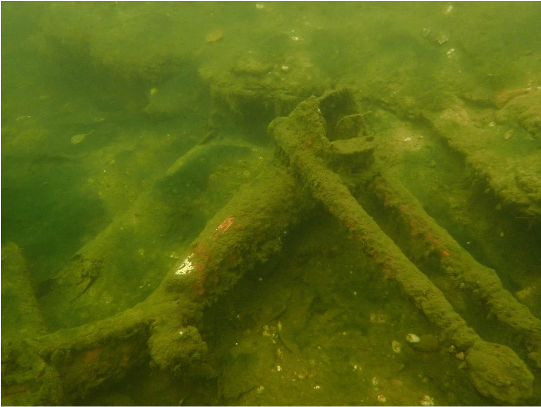
Falls jemand sein Mopped vermisst, hier liegt es