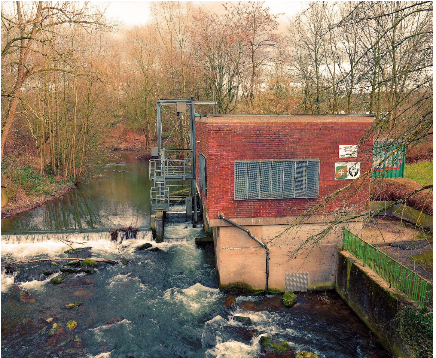
Das Bruthaus Aermühle