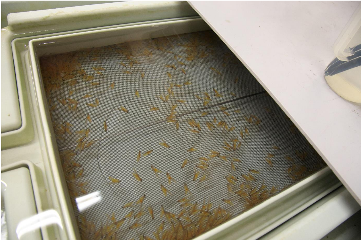
Lachsbrütlinge im Bruthaus

Für das Wanderfischprogramm NRW werden zurzeit 60000 Lachseier im Bruthaus ausgebrütet. Nach ca. 6 Monaten werden die Junglachse in Absprache mit dem LANUV in die Dhünn und untere Wupper ausgesetzt. Nach 1 bis 2 Jahre wandern die Junglachse in den Atlantik ab und kehren nach 1 bis 3 Jahren als laichfähige Fische zurück. Da die Verluste sehr groß sind, müssen wir das Wanderfisch Programm bis mindestens 2027 weiter betreiben, damit eine natürliche Vermehrung gesichert ist. Um selbst die Rückkehrer zu fangen, wollen wir den VAKI-Counter (ein Fischzähler, der auf – und absteigende Fische per Videosequenz registriert), der ein Teil des Thermorüssel-Projekt vom Wupperverband ist und dessen Förderprogramm im Sommer 2021 ausläuft, wieder zur